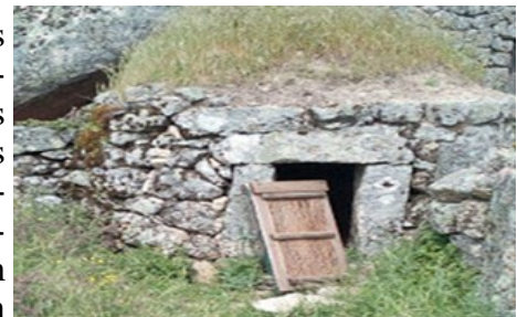
Furda em Monsanto

porcos para a engorda. José Carvalho, no seu livro sobre o porco, verdadeiro compêndio sobre este animal, chama-lhe o mealheiro dos ricos e dos pobres. E realça este facto, com as estatísticas da carne consumida, observando que na primeira metade do século XX cada pessoa comeu 10,8 Kg de carne de porco, para uma população de 8,5 milhões (2) . A base de alimentação do porco, duas vezes ao dia, era constituída por batatas, nabos, abóboras, beldroegas, alguns restos da alimentação humana e as ‘viandas’, geralmente de farelos. A ‘vianda’ era uma espécie de caldo feito com água misturada com estes tubérculos, vegetais e outros produtos, que se levavam ao lume para cozerem e, posteriormente, deitada na pia da furda do porco para a alimentação deste. A matação do porco em S. Miguel d’Acha é um acontecimento tradicional que se reveste de particular importância familiar, sob o ponto de vista económico, uma vez que as carnes, os enchidos e o toucinho, representam alimentos fundamentais da família ao longo do ano.