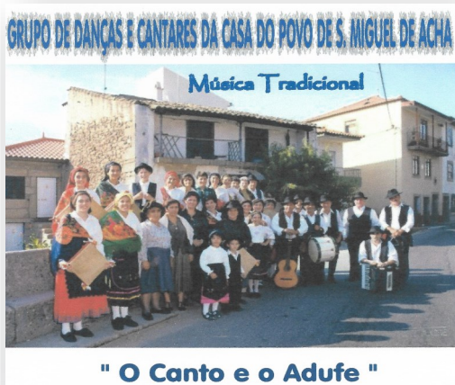
" O Canto e o Adufe "